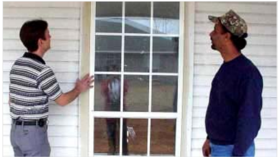
نايه گورډكان گوين له لاروان دهگن له گورډانه كان